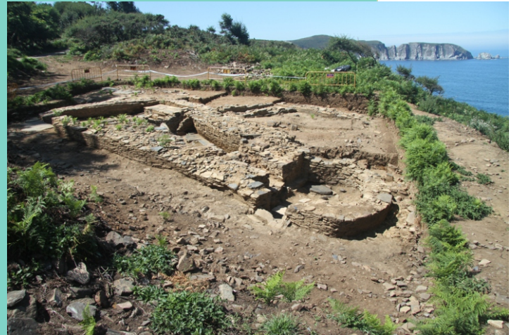
Castro na punta Sarridal. Restos dun balneario castrexo