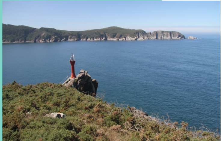
Faro na punta Sarridal