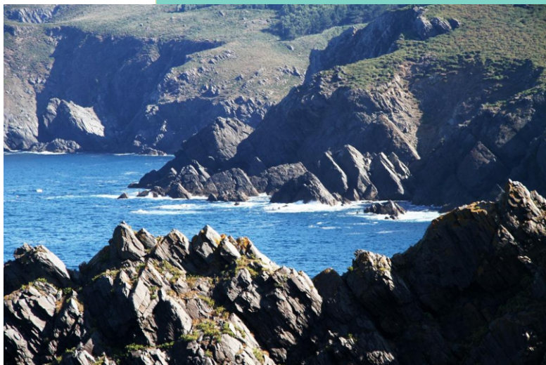
As da Salsa desde punta Ardillosa