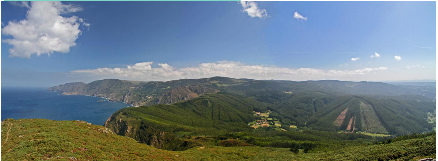
Vista desde o monte Tarroiba sobre os cantís e a serra da Capelada

Un percorrido de interese paisaxístico, ecolóxico e xeolóxico, que combina desprazamentos en coche e camiñadas para coñecer e impresionarse coa fachada atlántica da costa de Cedeira. Uns 9 km de ida máis 6 de volta, en coche, e 10 km a pé