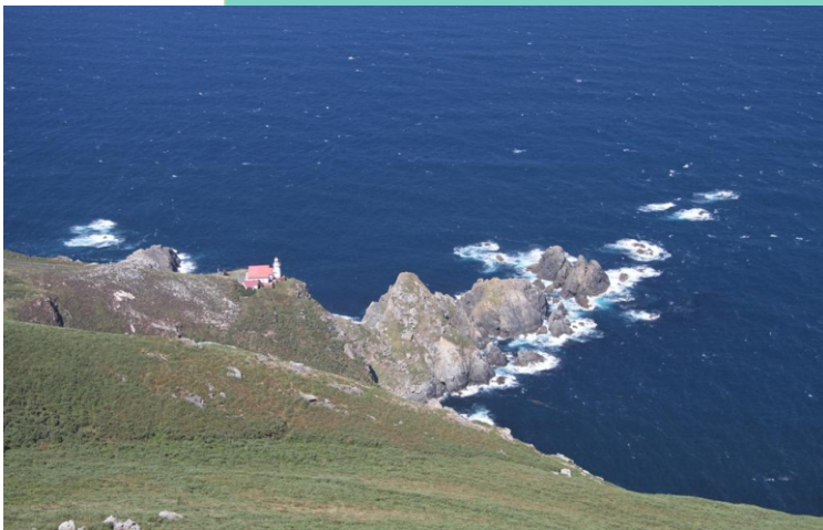
Punta Cadieira ou Candeeira