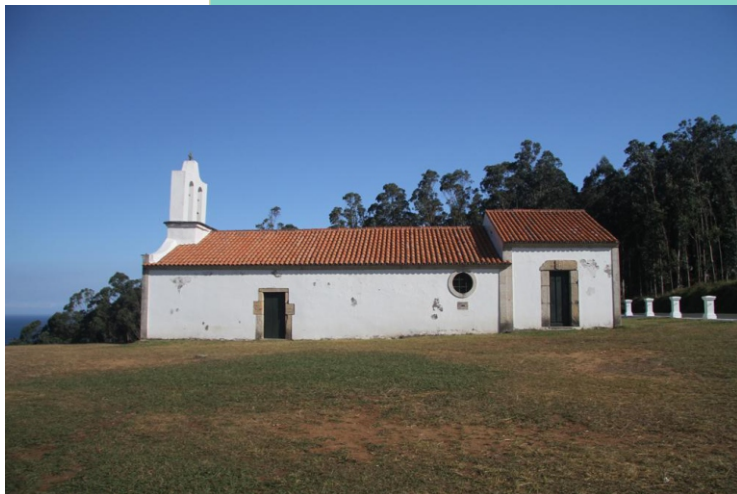
Capela de San Antonio de Corveiro e miradoiro