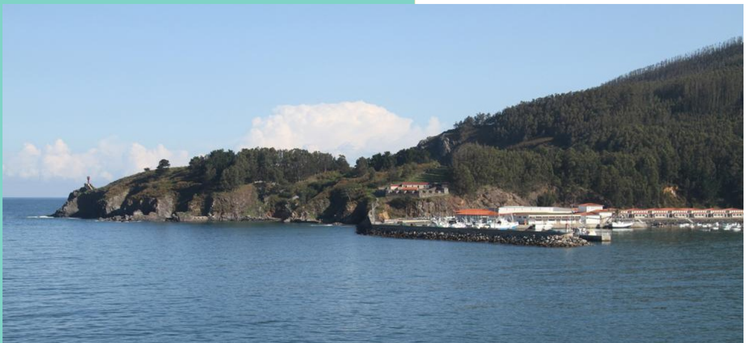
Punta Sarridal e porto de Cedeira