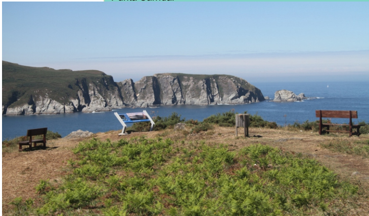
Miradoiro na punta Sarridal