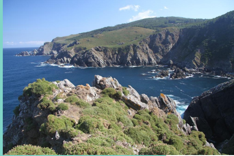
Puntas Sain e Felgueira desde a punta Ardilosa