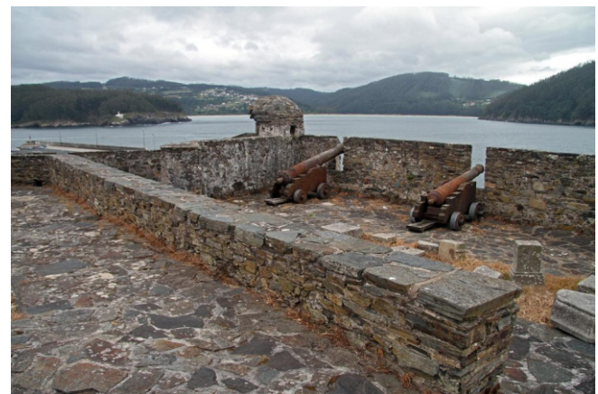
Castelo da Concepción na punta Sarridal