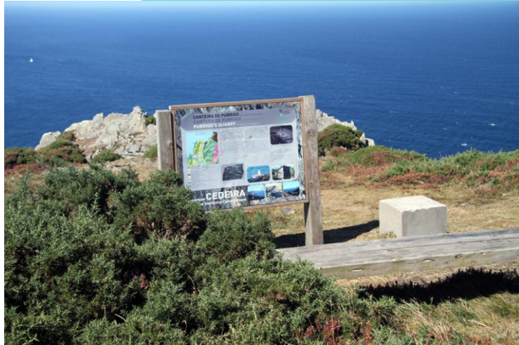
Canteira do Purrido, de interese polas rochas e polas vistas