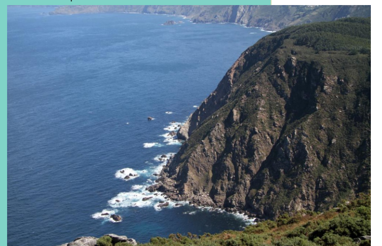
Punta Tarroiba desde a punta Balteira