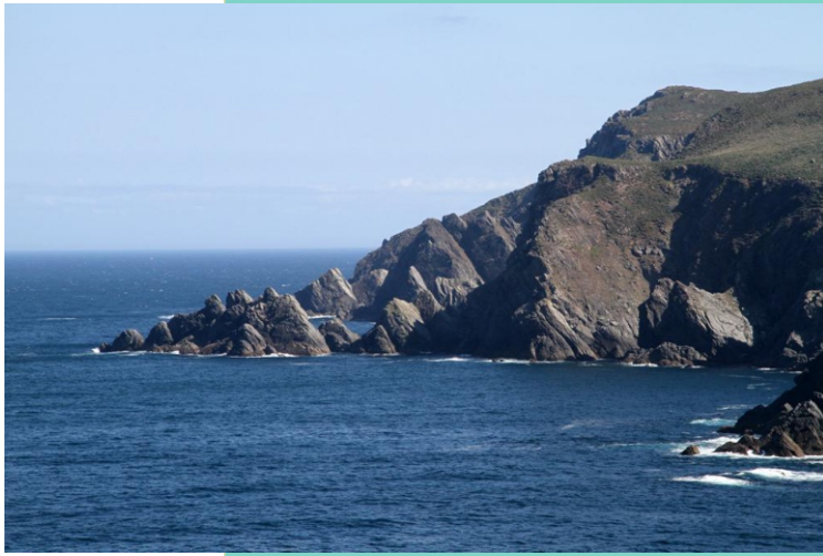
Punta Felgueira desde a punta Ardilosa