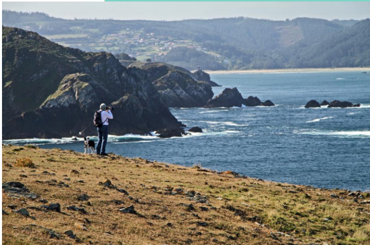
Punta Folgoso desde a punta das Mestas

As cabras fan equilibrios entre os bloques de rochas que se desprenden das paredes dos cantís