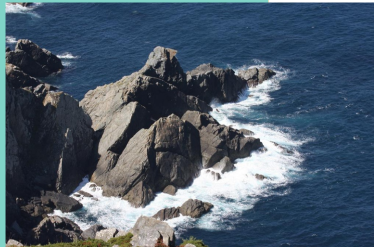
Punta Agudela ou do Fuciño desde o miradoiro do Purrido