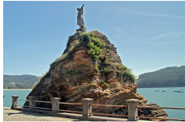
Pregues nas rochas do porto de Cedeira