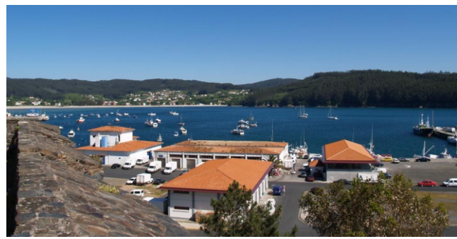
Porto de Cedeira