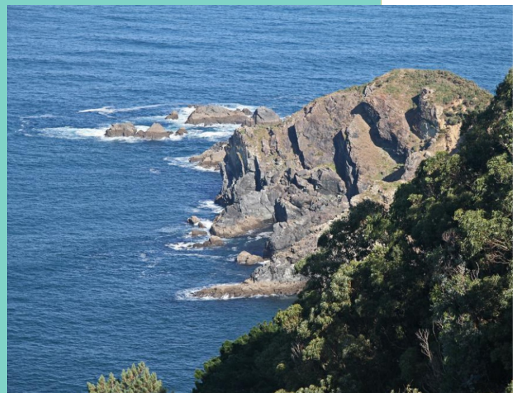
Punta Carreiro e As Brancas